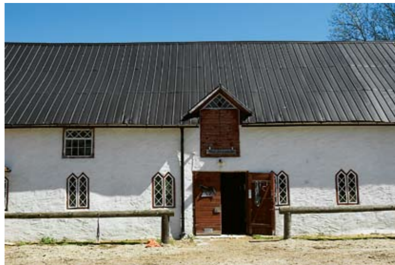
Änggårde är en bit Gotländsk idyll med anor från 1700-talet. De flesta stenhusen på Gotland är gjorda i kalksten. Stilen är samma som i Provence.

”– Det var sååå himla mycket jobb. Vi bodde i en husvagn den första tiden och bara arbetade och sov.”